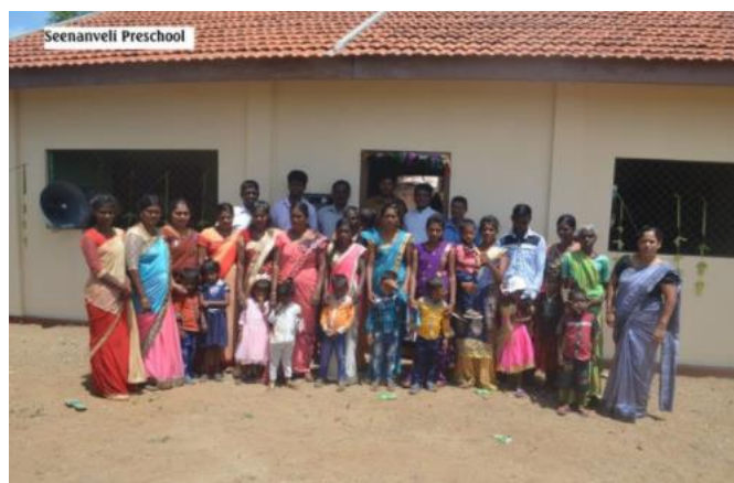
Figuur 1: Preschool incl. MCLS met enkele kinderen, ouders en kleuterleidsters in Verugal.

De overheid vindt dat de toekomst van jonge kinderen buitengewoon belangrijk is voor de toekomst van het land (Ceylon Today (2020)). Daarom willen ze nieuwe kleuterscholen voor jonge kinderen ontwikkelen. De regering concentreert zich daarbij ook op het verhogen van de toelage die wordt betaald aan leerkrachten in het kleuteronderwijs en de nodige stappen zullen binnenkort worden genomen. De regering wil een formele en verplichte kleuterschool-lerarenopleiding die zal bijdragen aan de juiste kennis en skills voor het verzorgen van goed