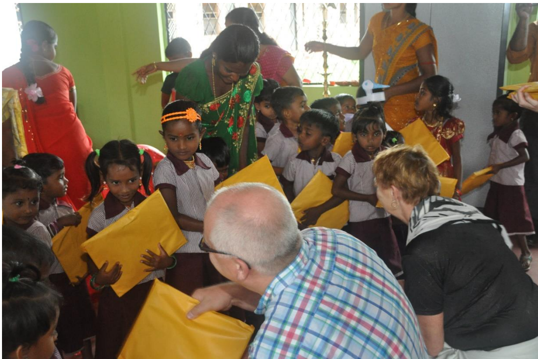
Een onderwijspakket als cadeau bij een werkbezoek aan preschool.

organisaties (NGO) en zijn mede overgeleverd aan de ouderbijdrage als het gaat om bouw, onderhoud, reparaties en verbeteringen aan de school. Kleuterscholen bouwen heeft voor de Sri Lankaanse overheid nog geen prioriteit. De overheid heeft er nog geen geld voor over. Er wordt 0,0001 procent (CEPA, 2016) van het bruto binnenlands product uitgegeven aan kleuteronderwijs. Daarbij valt kleuteronderwijs ook nog onder de verantwoordelijkheid van de provincies die geen eenduidig beleid voeren. De centrale regering is wel van plan om tot landelijk richtlijnen te komen m.b.t. kleuteronderwijs. Daarbij worden ze gestimuleerd door allerlei instanties waaronder de Wereldbank (2014) die in het rapport de noodzaak aangeeft om meer te investeren in kleuteronderwijs. Kinderen op Sri Lanka zijn in principe leerplichtig van 6 tot 16 jaar. De structuur van het onderwijs op Sri Lanka biedt echter geen gelijke kansen. Het onderwijs vanaf 6 jaar is in principe gratis is en voor iedereen toegankelijk. Maar de maatschappelijke status en vooral financiële middelen bepalen in welke mate en tot welk niveau een kind onderwijs kan volgen.