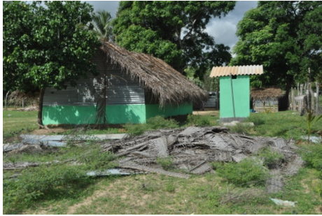
Noodgebouw in Thevipuram, in dezelfde slechte staat als het noodgebouw in Alampil. Father Yavis in gesprek met een kleuterleidster over de aanvraag voor een nieuwe school.