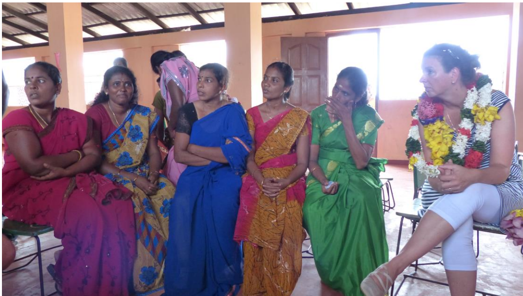
Gesprek over de organisatie van de microkredieten. (juli 2013)

Iedereen die gebruik wenst te maken van het microkrediet moet dit aangeven. (stap 1). In twee volgende stappen moet een plan worden uitgelegd. Dit plan wordt getoetst. Stap 4 is het ondertekenen van het contract samen met 2 medeverantwoordelijken voor de lening. Samen zijn ze verantwoordelijk voor het terugbetalen van de lening. De rente is 1% per maand. Dit is in Sri Lanka een heel acceptabel percentage (ongeveer de helft van de reguliere tarieven). Er wordt door de onderwijzeressen een boekhouding bij gehouden.