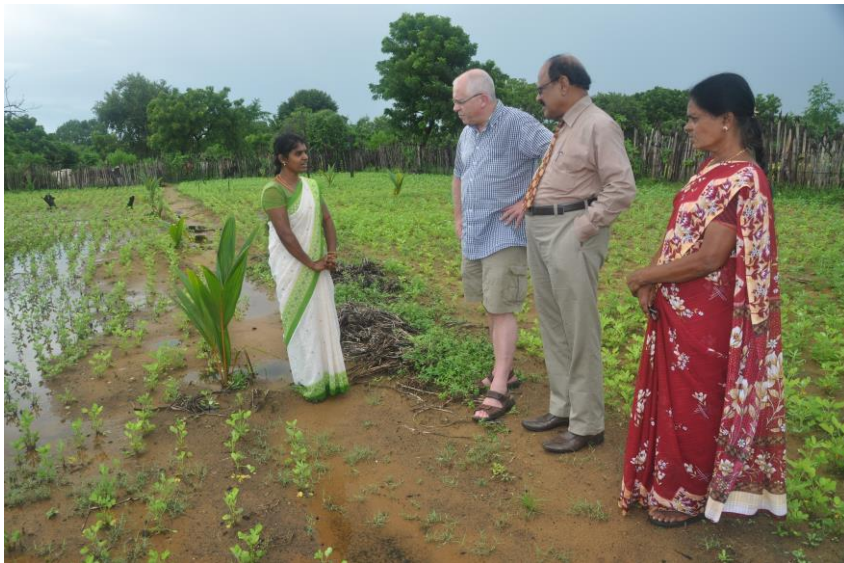
voorbeeld microkrediet: plantage pinda's. (november 2015)