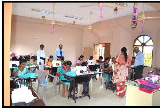
Enkele naaisters van het VTC project.